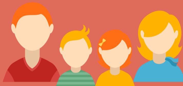
JORGE (33), MARCELA (32), FABIÁN (4) Y MARTINA (6)

Arriendan un depto. de 35 m 2 . En conjunto tienen un ingreso de $650.000 , de los cuales destinan un 50% para pagar el arriendo.